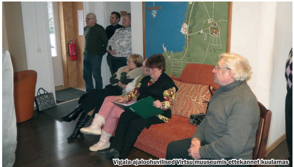
Vigala ajaloo huvilised Virtsu muuseumis ettekannet kuulamas