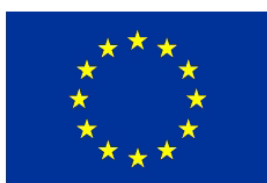
Euroopa Liit Euroopa Sotsiaalfond

Tel.5662 4701 või e-post: ilmi@vigalattk.ee