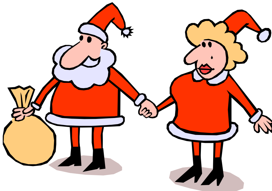
Perekond Päkansonide sõbralik käepigistus enne "tööle asumist"

"Piparkoogid muusikas" on vahva laulusaade, kus mängijatel tuleb ära arvata populaarsed jõululaulud. "Mammu ja Päkansoni vägiteos" tuleb sooritada publiku valvsa silma all igasuguseid trikke.